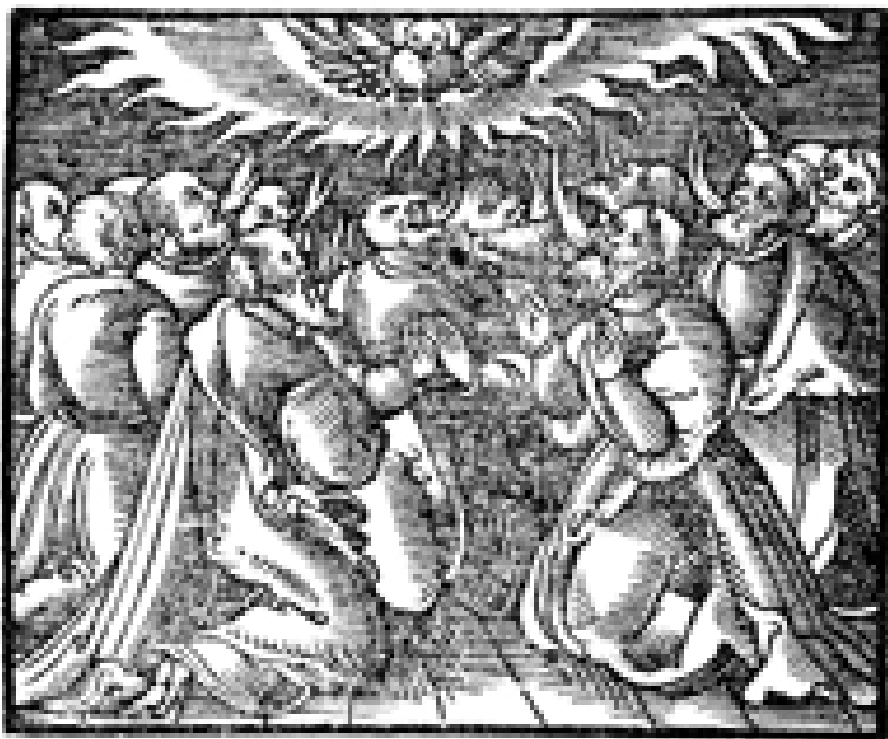
Melanchthon, Philipp, 1497-1560: Seslání Ducha svatého o Letnicích

Všecko mohu v Kristu, který mi dává sílu. Filipským 4,13